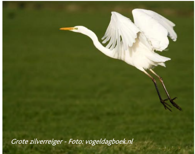
Grote zilverreiger

De grote zilverreiger is een opvallende vogel. Zijn verenkleed is helemaal wit, hij heeft een lange en dunne hals. Het dier leeft van vissen en amfibieën, waarop hij jaagt terwijl hij langzaam door het water waadt. De grote zilverreiger staat op de 'Rode Lijst' van bedreigde diersoorten, maar zijn aantal is de laatste jaren aan het toenemen. Op het eerste gezicht lijkt de grote zilverreiger op de kleine zilverreiger, maar die laatste heeft het hele jaar door een zwarte snavel. Leuk dat ook deze zeldzaamheid de Turfmeersen bezoekt!