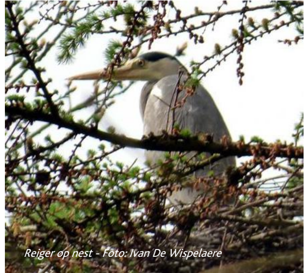
Reiger op nest - Foto: Ivan De Wispelaere

ook de eekhoortjes waren druk in de weer om nestmateriaal te verzamelen. Het voorjaar is ingezet in Puyenbroeck.