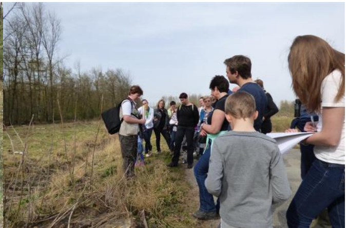
Op kraambezoek bij de reigers