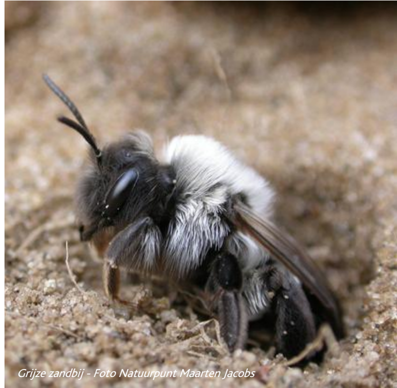
Grijze zandbij

Echte uitslovers zijn de grijze zandbijen wel! Zij zoe-men langs je oren als kleine gele poederdoosjes, beladen met stuifmeel van boswilgen. Ze hebben een diepe loodrechte tunnel gegraven van wel een halve meter diep. Op het einde van deze schacht hebben zij horizontaal gangen gemaakt en hun broedkamers keurig gebouwd. Grijze zandbijen zijn zagezegd solitaire bijen, omdat elk vrouwtje haar eigen nest maakt, maar eigenlijk zoeken ze heel graag elkaars gezelschap op. Dat je merk je al vlug, want grijze zandbijen verraden hun aanwezigheid daar de vele kleine kegelvormige zandhoopjes naast elkaar. Hieruit vliegen af en aan kleine grijsfluwelen bijtjes rond,